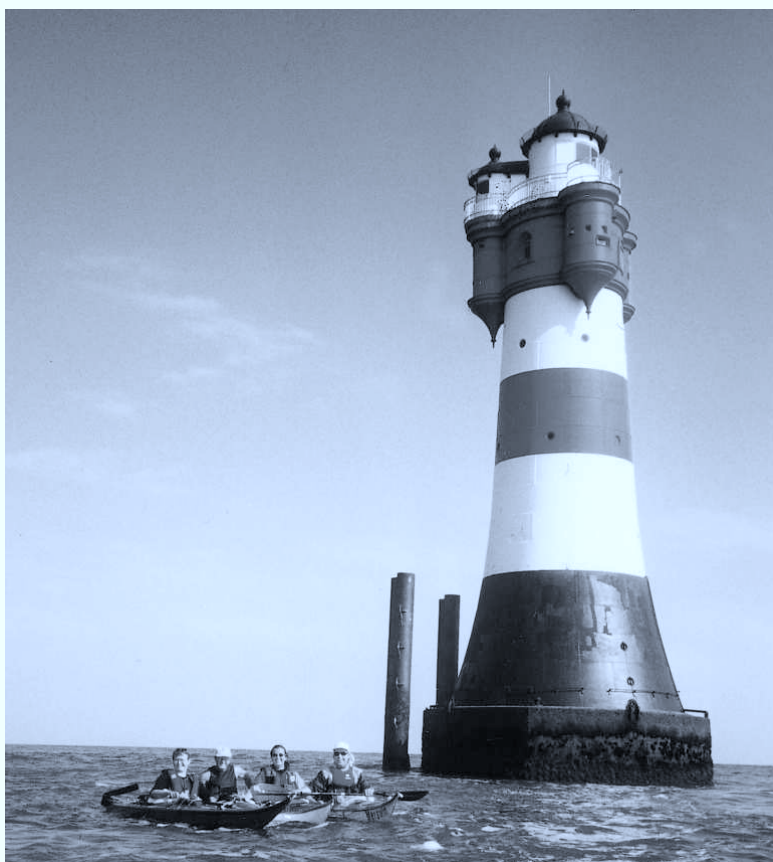
Roter Sand, Nordsee Baujahr 1884, Höhe 28 m, 53° 51' N 08° 05' E

L'association SALZWASSER UNION vit de l'engagement de ses membres !