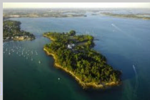
Île de Berder