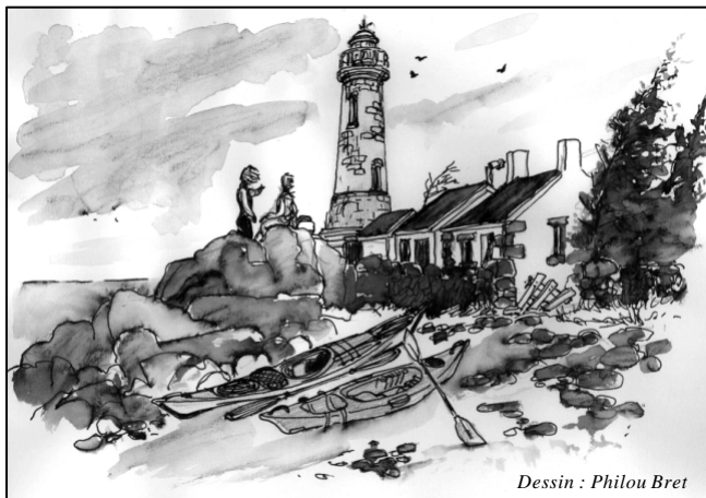
Dessin : Philou Bret